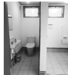
観光農園のトイレ