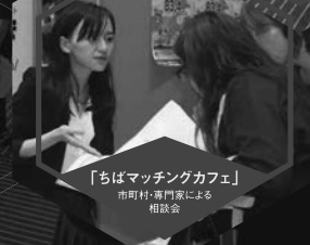
「ちばマッチングカフェ」 市町村・専門家による 相談会