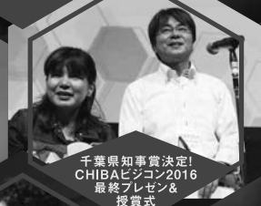
千葉県知事賞決定! CHIBAビジョン2016 最終プレゼン & 授賞式