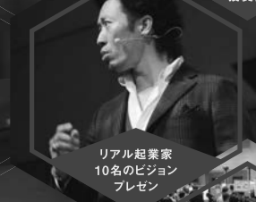
リアル起業家 10名のビジョン プレゼン